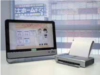
タッチパネルパソコンとプリンター