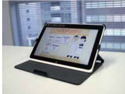
タブレットパソコン